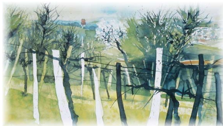
Frühling im Weingarten