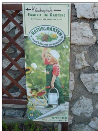
Bau einer Kräuterspirale im Kindergarten Martinsdorf

Viel Spaß bereitete den Kursteilnehmern das anschließende Kochen. Schafgarbe, Gundrebe, Gänseblümchen, Taubnessel, Brennessel, Vogelmiere, Löwenzahn, Bärlauch und Spitzwegerich wurden zu Vollkornweckerln, Aufstrichen, Suppe, Gemüse, Püree, Salat, Quiche und Muffins verarbeitet. Zum abschließenden Verzehr der Köstlichkeiten wurde Brennesseltee getrunken. (Foto Seite 8!)