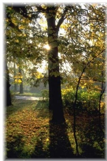
Gaweinstal, Park Bahnstraße

Auersthal, Bad Pirawarth, Ebenthal, Gaweinstal, Groß-Schweinbarth, Hohenruppersdorf, Matzen-Raggendorf, Prottes, Schönkirchen-Reyersdorf, Spannberg, Sulz im Weinviertel, Velm-Götzendorf Prof. Knesl-Platz 1, 2222 Bad Pirawarth