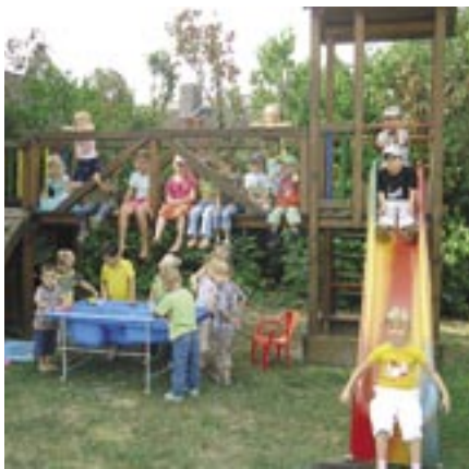
Wasserspiele im Kindergarten Schrick