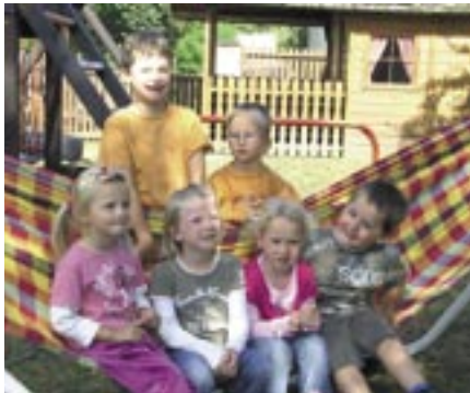
Relaxen in der Hängematte im Kindergarten Gaweinstal II

Neben lustigen Wasser- und Sandspielen reichte das bunte Programm über Malen und Basteln bis zum Relaxen in der Hängematte.