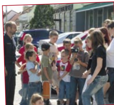
Bei der Polizei