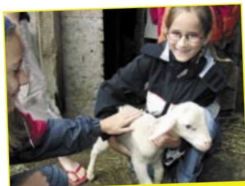
Alles rund ums Schaf

Danke allen, die bei der Organisation mitgeholfen und damit zum Erfolg dieser Ferienaktion beigetragen haben.