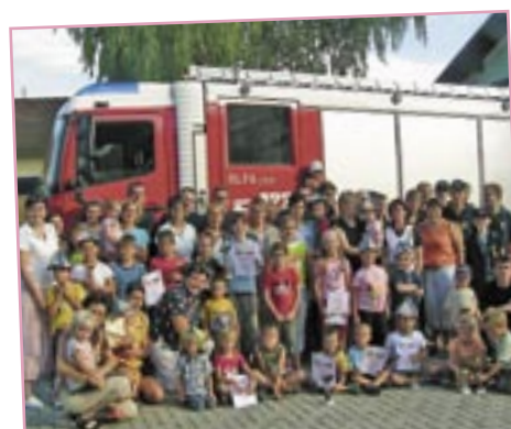
Bei der FF Schrick