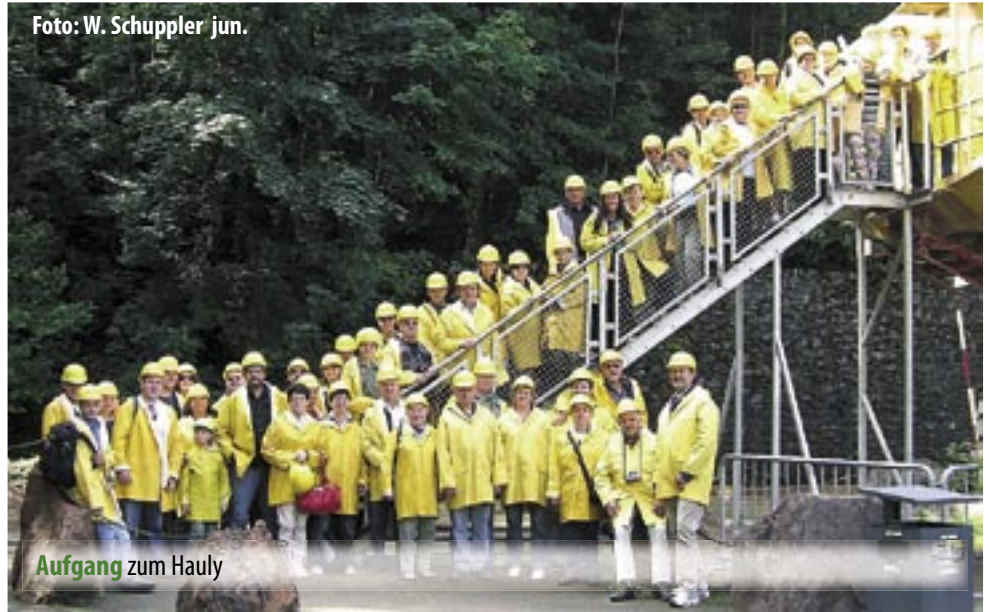
Aufgang zum Hauly