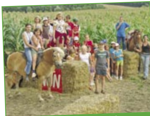
Labyrinth im Maisfeld