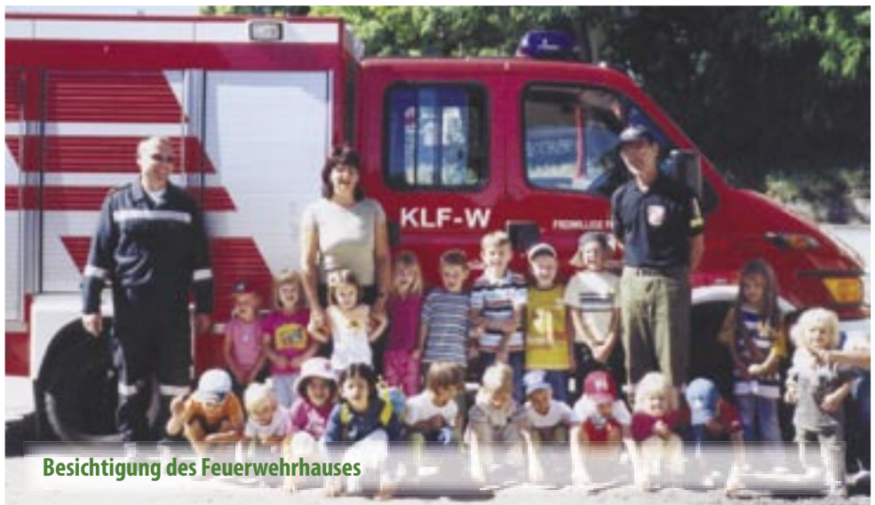
Besichtigung des Feuerwehrhauses

dert und mussten den Kindern Rede und Antwort in Fragen Feuerwesen stellen. Selbstverständlich wurde auch das Feuerwehrauto ausprobiert.