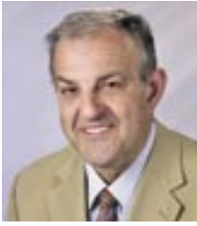
Bürgermeister Johann Plach