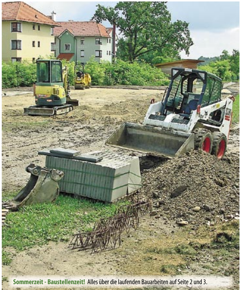
Sommerzeit - Baustellenzeit! Alles über die laufenden Bauarbeiten auf Seite 2 und 3.

Mo, Di, Do: 8-12 und 13-16 Uhr Mi: 8-12 und 13-19 Uhr, Fr: 8-12 Uhr