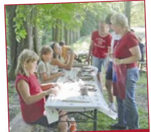
Töpfern mit Lehm