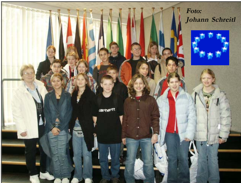
Die 3. Klassen der Hauptschule Gaweinstal besuchten das Europäische Parlament!