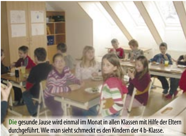
Die gesunde Jause wird einmal im Monat in allen Klassen mit Hilfe der Eltern durchgeführt. Wie man sieht schmeckt es den Kindern der 4 b-Klasse.