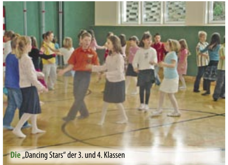
Die „Dancing Stars“ der 3. und 4. Klassen