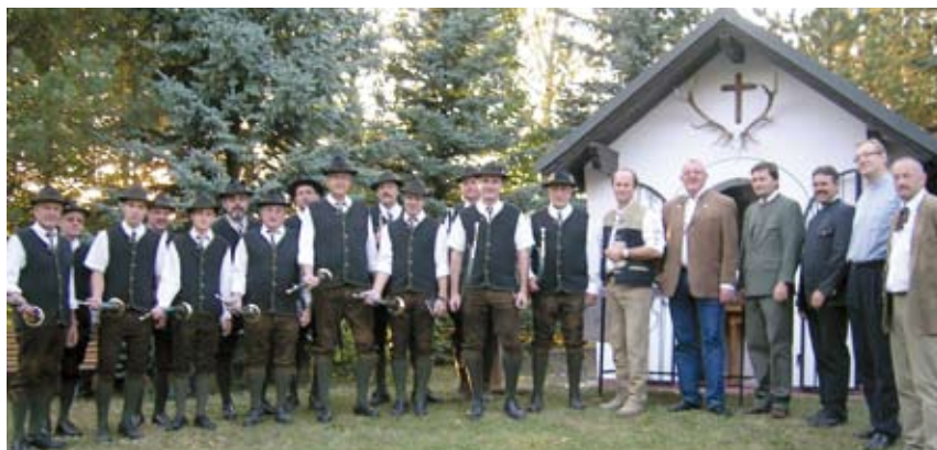
Hubertusmesse in Pellendorf