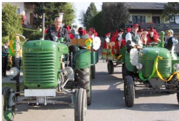
Tag der Blasmusik mit dem Musikverein Pellendorf