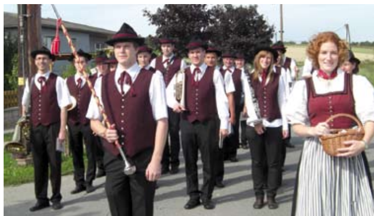
Tag der Blasmusik mit der Musikkapelle Martinsdorf