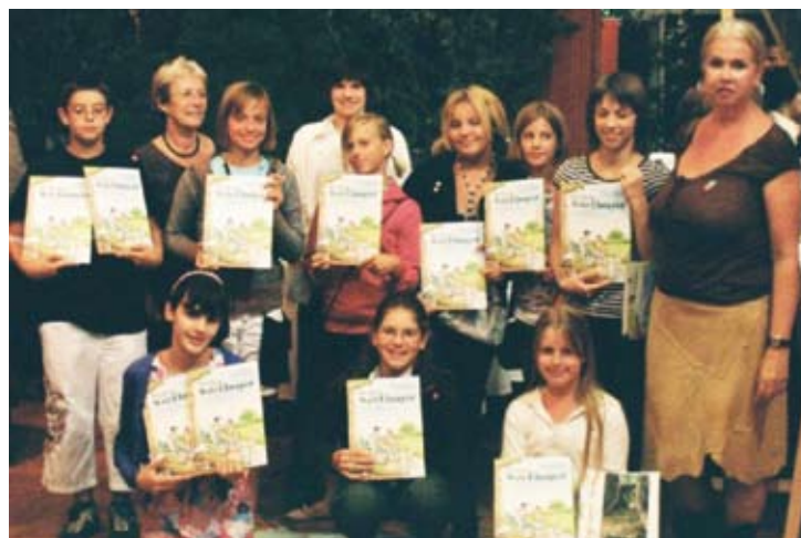
Buchpräsentation „Kleiner Wald-Elmayer“