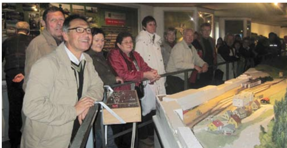
Modellbahnmuseum Mariazellerbahn in Kirchberg an der Pielach

Entlang des Pielachtaler Rundwanderweges konnte man trotz wechselhaftem Wetter einen schönen Ausblick genießen. Nach dem Mittagessen wurde das Modellbahnmuseum Mariazellerbahn in Kirchberg an der Pielach besucht. Die Wanderer ließen den Tag beim Heurigen in Klein-Engersdorf ausklingen.