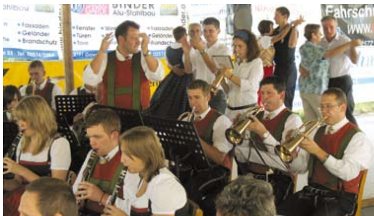
Kirtagsfrühschoppen am Morandusplatz

lang mit klingendem Spiel durch den Ort. Viele Einwohner unterstützten diese Aktion, indem sie für die Anschaffung neuer Instrumente und Uniformen spendeten und Verpflegungsstationen einrichteten. Es war ein gelungener Sonntag!