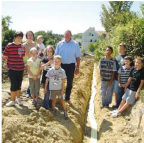
Die Kinder freuen sich auf den neuen Schulweg.

Die Brücke über die Bischof Schneider-Straße wird in den nächsten Tagen fertig gestellt. Um einen sicheren Schulweg für unsere Kinder zu schaffen, habe ich den Auftrag gegeben, den Verbindungsweg und die Beleuchtung entlang der Kamptalwohnungen zum Erlen- und Birkenweg rechtzeitig zu Schulbeginn zu errichten.