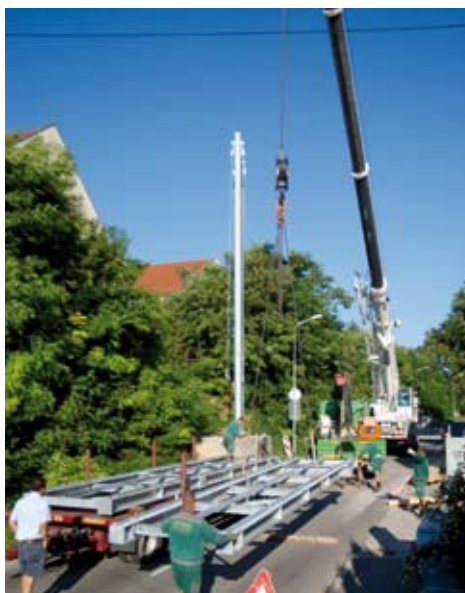
Aufsetzen der Brücke

Die Umwidmungen in Schrick, sowohl das Bauland als auch das Betriebsgebiet an der B46 sind abgeschlossen. Somit kann mit der Aufschließung begonnen werden.