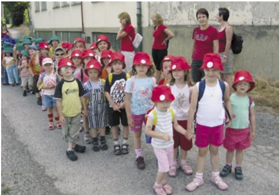
Die Kinder waren durch ihre roten, blauen und grünen Kapperln leicht zu unterscheiden.

dem Radweg nach Bad Pirawarth. Beim Reha-Zentrum hatten die Kinder Gelegenheit, sich am Spielplatz so richtig auszutoben. Zu Mittag schmeckten dann die Würstel im Gasthaus Novakowic. Nach diesem wunderschönen Vormittag durfte die lustige Schar mit dem Bus nach Hause fahren.