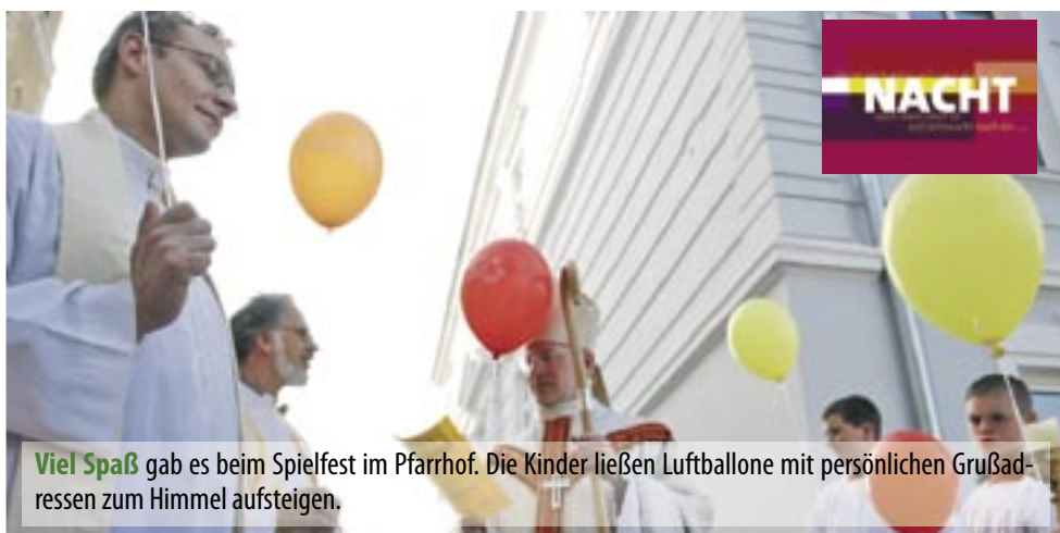
Viel Spaß gab es beim Spielfest im Pfarrhof. Die Kinder ließen Luftballone mit persönlichen Grußadressen zum Himmel aufsteigen.