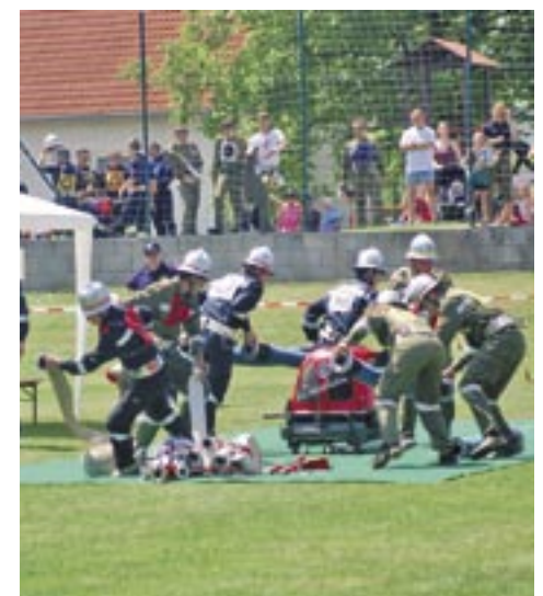
Die Wettkampfgruppe Atzelsdorf