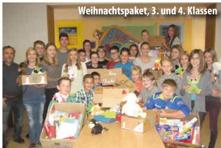
Weihnachtspaket, 3. und 4. Klassen