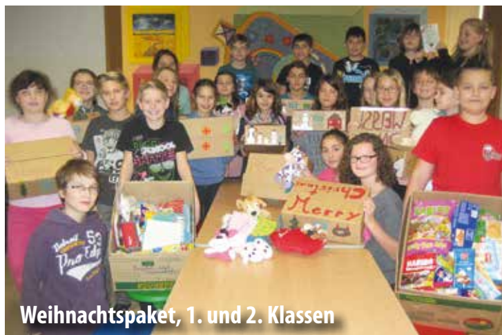
Weihnachtspaket, 1. und 2. Klassen