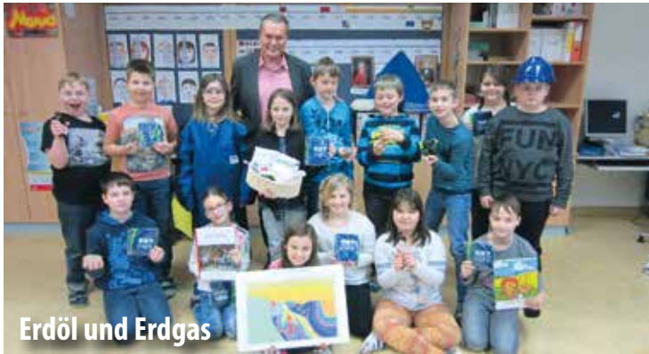
Erdöl und Erdgas