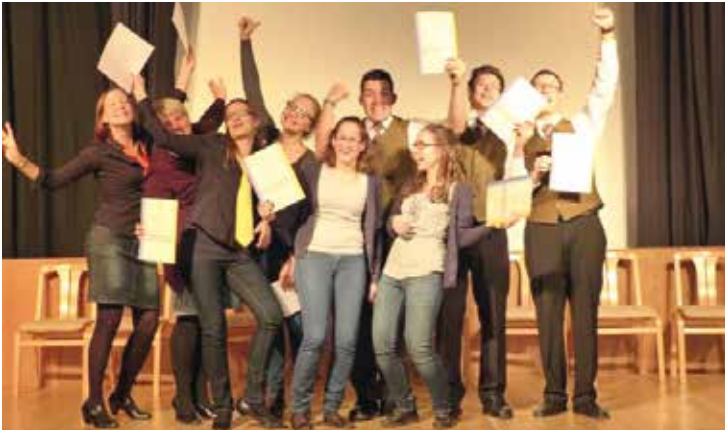
Freude über drei ausgezeichnete Erfolge beim Kammermusikwettbewerb 2015