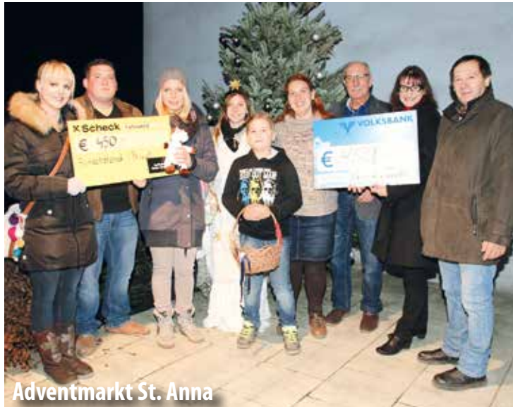
Adventmarkt St. Anna