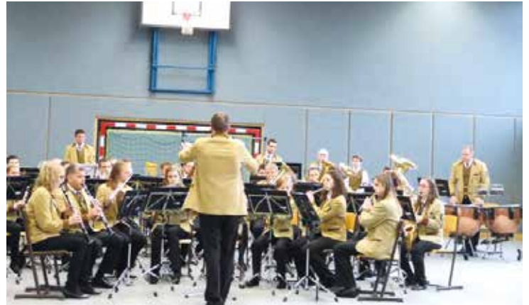
Die Musikkapelle Gaweinstal und Umgebung bei der Konzertmusikbewertung 2015