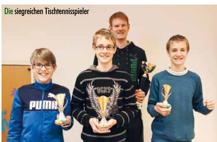
Die siegreichen Tischtennispieler