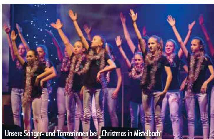
Unsere Sänger- und Tänzerinnen bei „Christmas in Mistelbach“