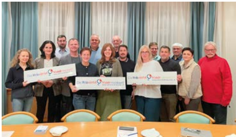
Der Vorstand der Kleinregion

Die Kleinregion Südliches Weinviertel - Die Region der kurzen Wege