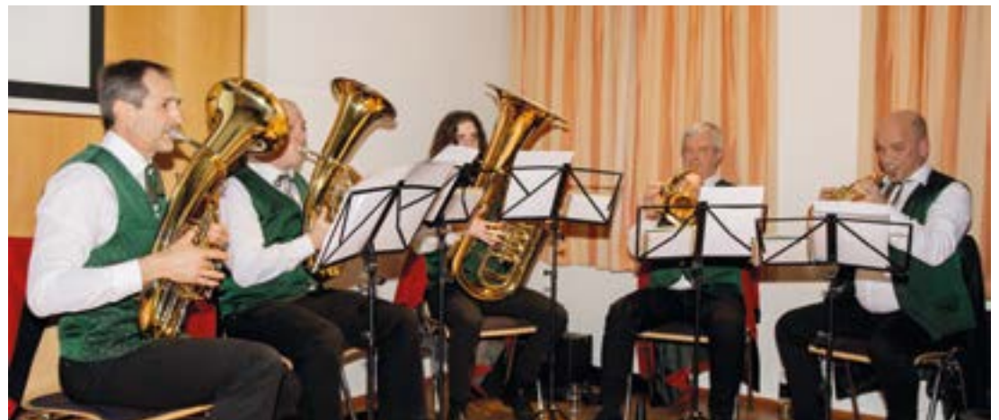
Das Ensemble der Musikkapelle Pellendorf sorgte für den musikalischen Rahmen.