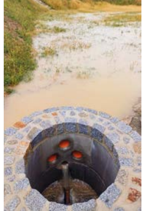
Das erst kürzlich fertiggestellte Becken Ost in Höbersbrunn

Dass die Gemeinde Gaweinstal das Unwetter relativ glimpflich überstanden hat, ist nicht zuletzt dem in der Vergangenheit massiv ausgebauten Hochwasserschutz zu verdanken. Insgesamt hat die Marktgemeinde Gaweinstal in den vergangenen 15 Jahren rd. 2,2 Mio. € abzüglich der Landesförderungen in Hochwasserschutzmaßnahmen investiert. Rückhaltebecken und Entwässerungssysteme haben unsere Gemeinde wohl vor einer größeren Katastrophe bewahrt.