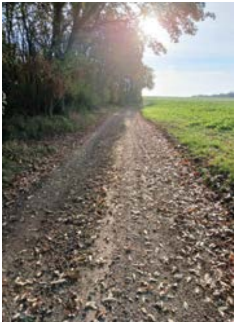
Radweg Bogenneusiedl - Pellendorf