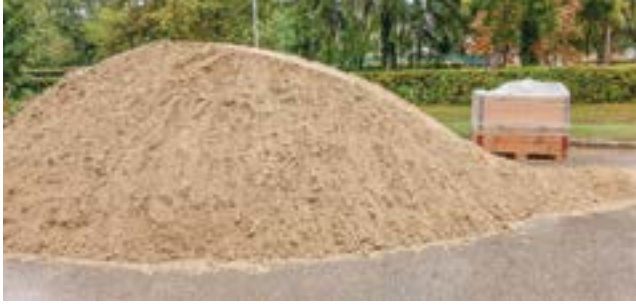
Sand und Säcke lagen zur freien Entnahme beim Bauhof Gaweinstal bereit.

Die gewaltigen Regenmengen und das damit verbundene Hochwasser Mitte September haben österreichweit zu katastrophalen Zuständen geführt. Besonders davon betroffen war Niederösterreich.