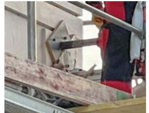
Bohrungsarbeiten quer durch den Gebäudekörper