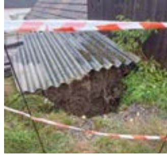
Eingestürzter Keller in der Annagasse

Als im Vorfeld das zu erwartende Ausmaß des Unwetters deutlich wurde, stellten die Mitarbeiter des Bauhofes Gaweinstal Sand und Säcke zur Verfügung. Hier konnten sich alle Gemeindegewohnerinnen und Bürger bedienen, um Wassereintritte an deren Eigentum zu verhindern oder zu begrenzen.