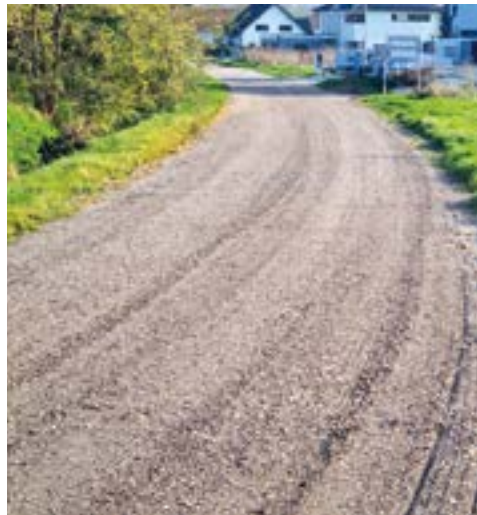
Am Graben - Martinsdorf

Im Oktober wurden im gesamten Gemeindegebiet Radwege, Feldwege und eine Gemeindestraße saniert. Durch Befahren mit PKW sowie schweren landwirtschaft-