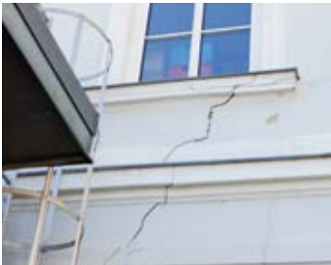
Rissbildungen an der Innen- und Außenseite des Gemeindeamtes

Bereits zuvor wurden Teile des Daches erneuert. Das Flachdach im nordwestlichen Bereich des Gebäudes war undicht und es konnte Wasser in die Dämmung eindringen. Die Kosten dafür belaufen sich auf rund € 8.000,-.